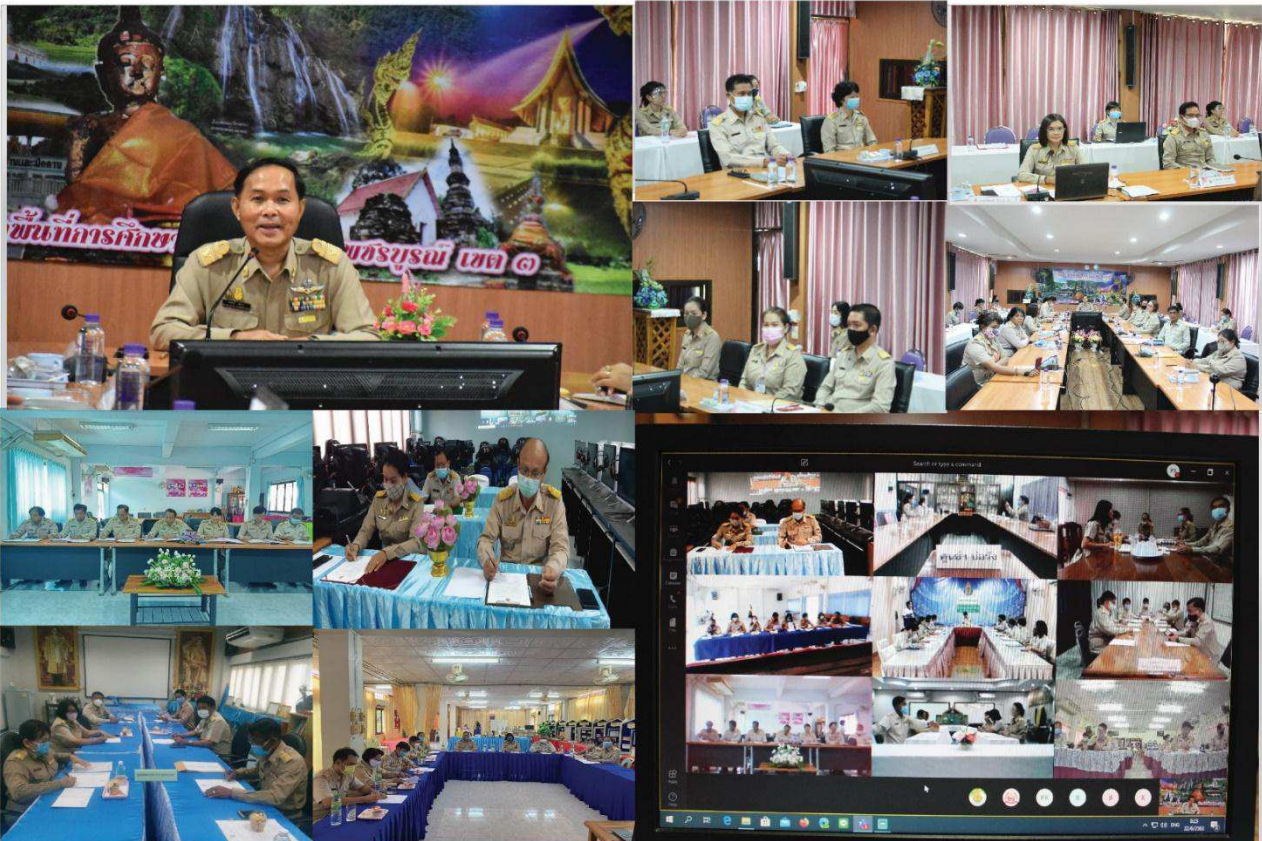
สำนักงานเขตพื้นที่การศึกษาประถมศึกษาเพชรบูรณ์ เขต 3 เลขที่ 54/2 หมู่ 4 ต.บึงสามพัน อ.บึงสามพัน จ.เพชรบูรณ์ หมายเลขโทรศัพท์ 0 5673 1256 หมายเลขโทรสาร 0 5673 1772