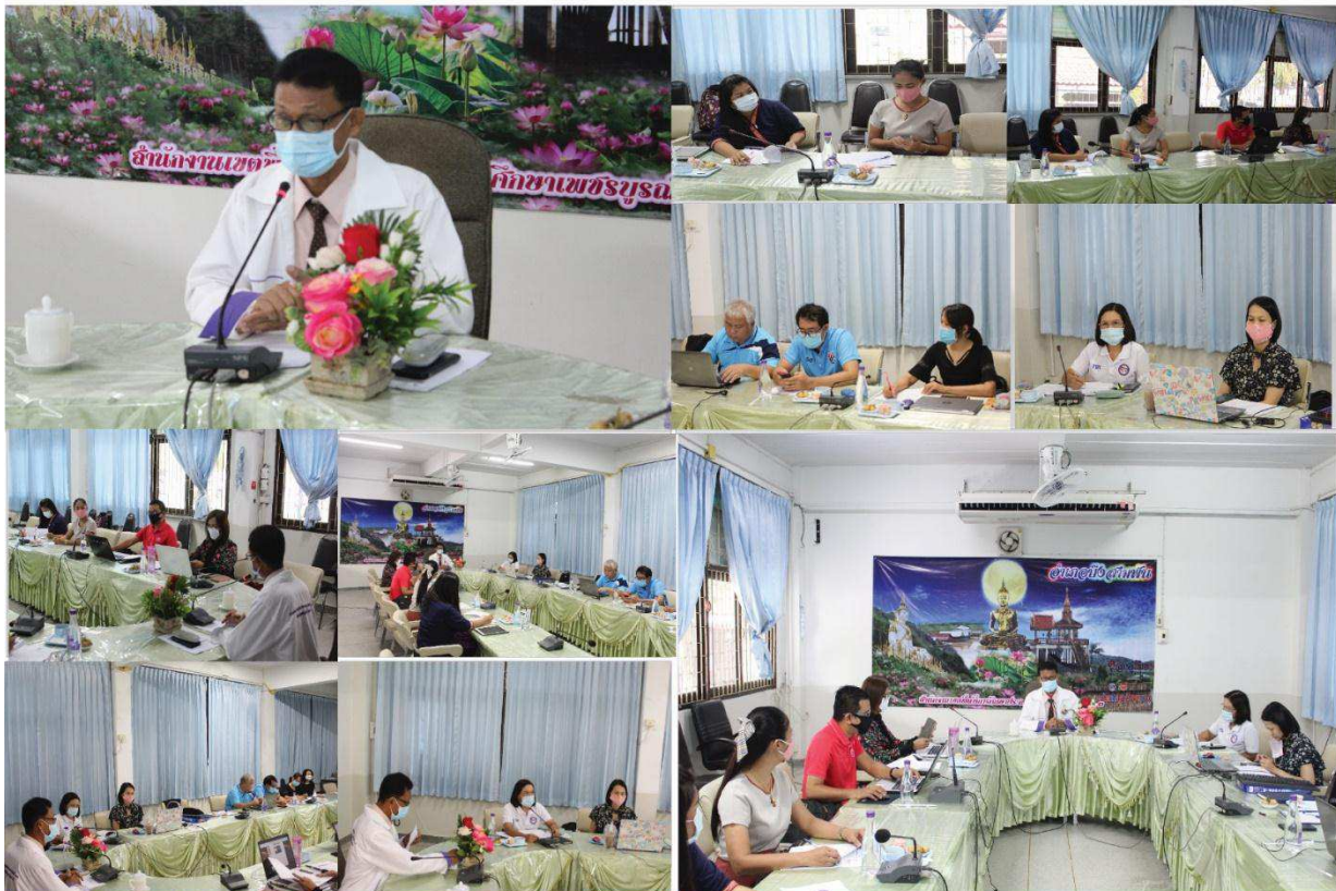
สำนักงานเขตพื้นที่การศึกษาประถมศึกษาเพชรบูรณ์ เขต 3 เลขที่ 54/2 หมู่ 4 อ.บึงสามพัน อ.บึงสามพัน จ.เพชรบูรณ์ หมายเลขโทรศัพท์ 0 5673 1256 หมายเลขโทรสาร 0 5673 1772