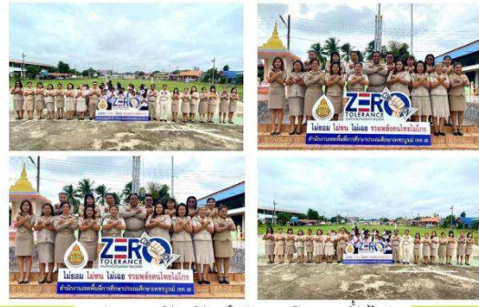
ประชาสัมพันธ์ ฝ่ายบริหารทั่วไป