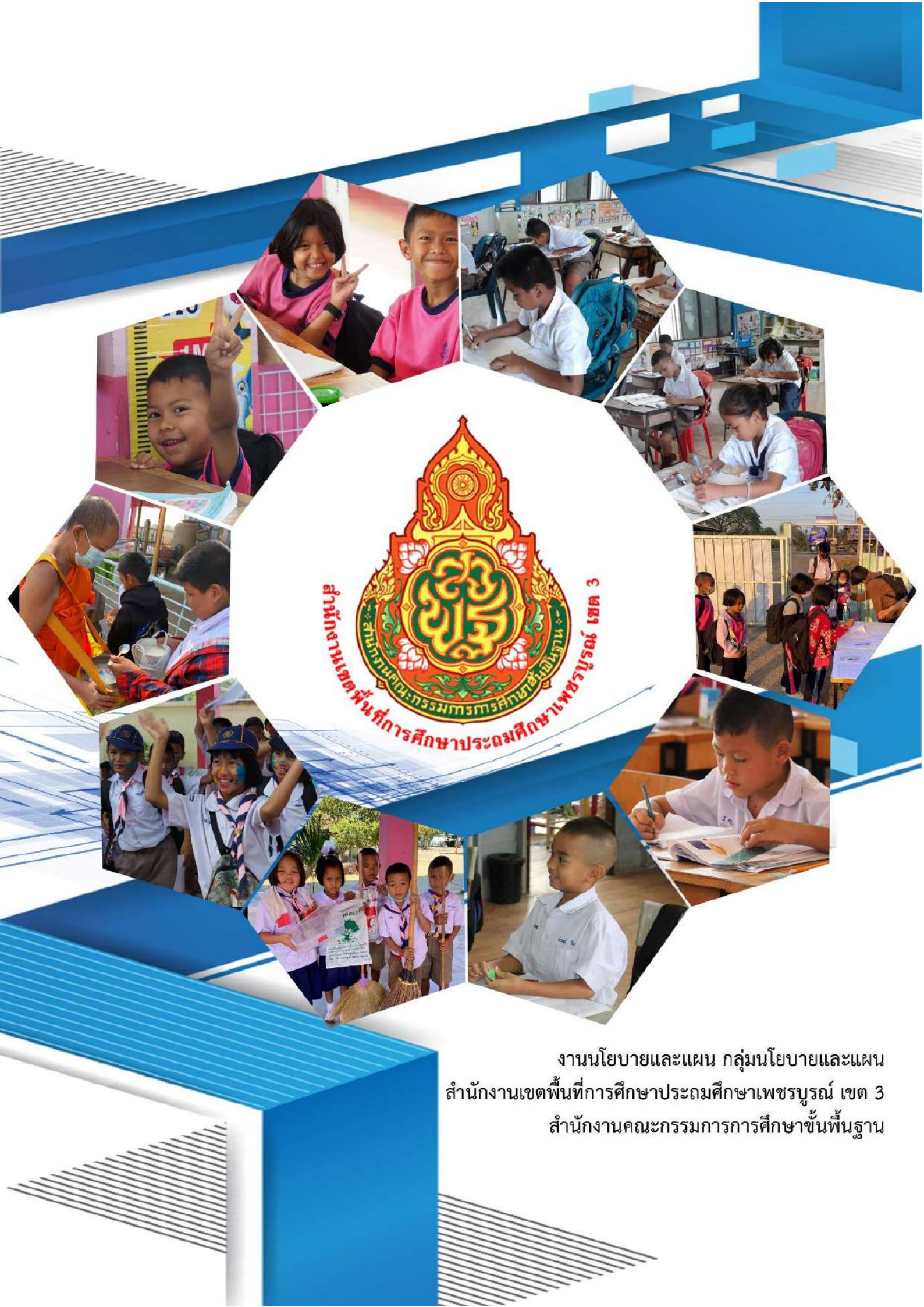
งานนโยบายและแผน กลุ่มนโยบายและแผน สำนักงานเขตพื้นที่การศึกษาประถมศึกษาเพชรบูรณ์ เขต 3 สำนักงานคณะกรรมการการศึกษาขั้นพื้นฐาน