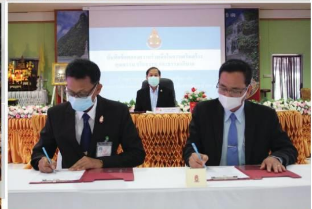
สำนักงานเขตพื้นที่การศึกษาประถมศึกษาเพชรบูรณ์ เขต 3 เลขที่ 54/2 หมู่ 4 ต.เมืองสามหมื่น อ.เมืองสามหมื่น จ.เพชรบูรณ์ หมายเลขโทรศัพท์ 0 5673 1256 หมายเลขโทรสาร 0 5673 1772