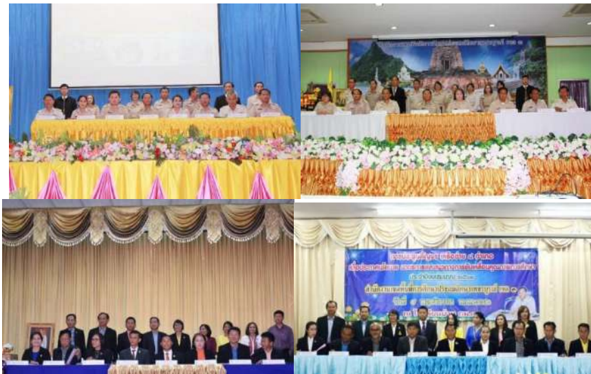
การประชุมนิเทศสัญจรเครือข่าย 4 อำเภอ การขับเคลื่อนนโยบายมาตรการและแนวทางการดำเนินการขับเคลื่อนคุณภาพการศึกษา