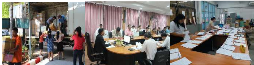
การเตรียมความพร้อมก่อนสอบ