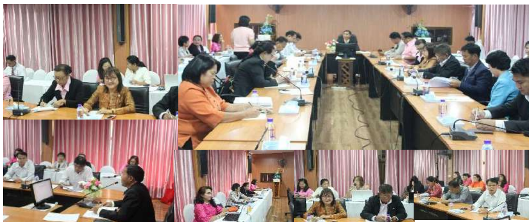
การประชุมประธานศูนย์ประสานงานอำเภอ/ประธานศูนย์พัฒนาวิชาการ