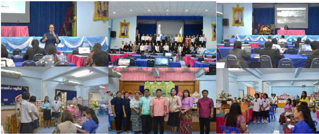
การจัดประชุมวางแผนและจัดกิจกรรมแลกเปลี่ยนเรียนรู้ (Symposium)