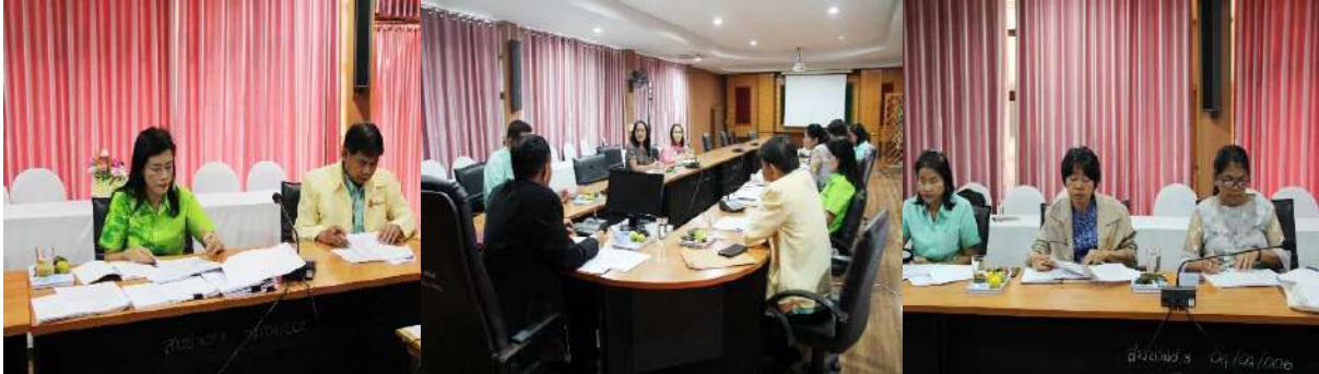
การประชุมสรุปผลการประเมินควบคุมภายในภาพรวม