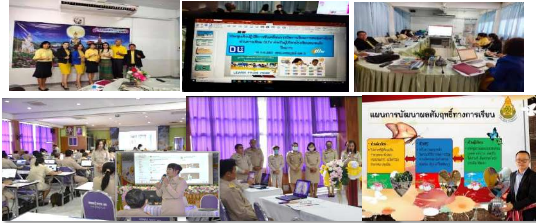
การประชุมคณะวิทยากร และการประชุมเชิงปฏิบัติ การขับเคลื่อนการจัดการเรียนการสอนทางไกล ผ่านดาวเทียม DLTV สำหรับผู้บริหาร