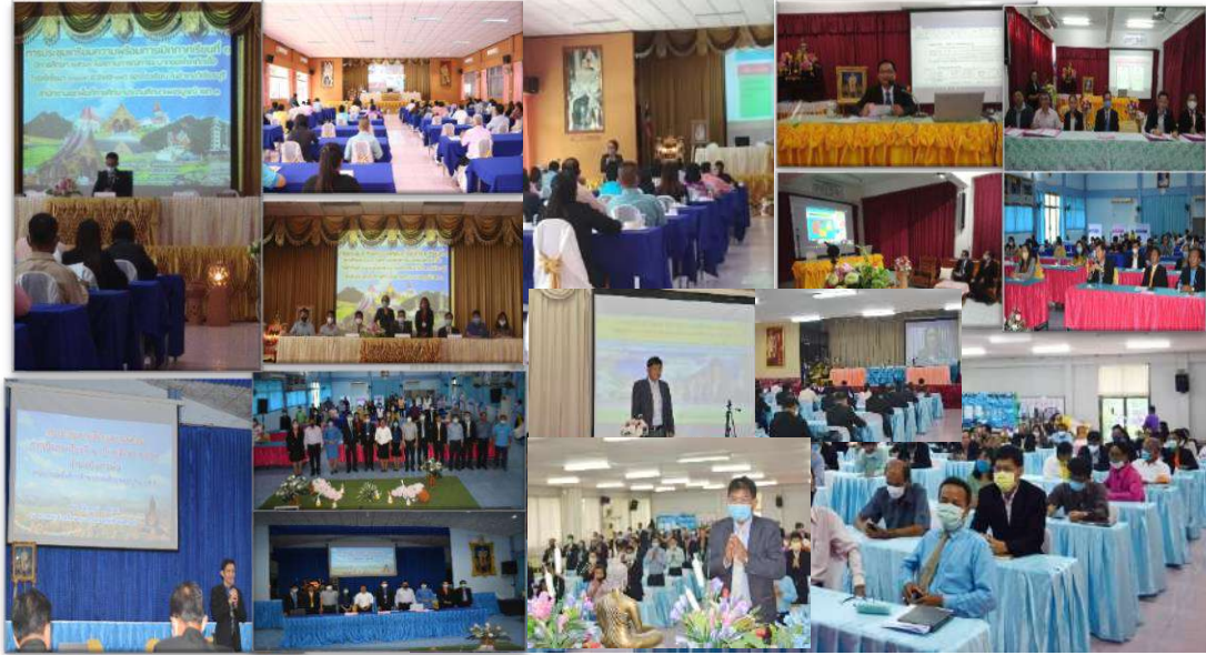
การประชุมพิเศษสัญจรการเตรียมความพร้อมการเปิดภาคเรียนที่ 1 ปีการศึกษา 2563 ในสถานการณ์การแพร่ระบาดของโรคติดเชื้อไวรัสโคโรนา 2019 (COVID -19)