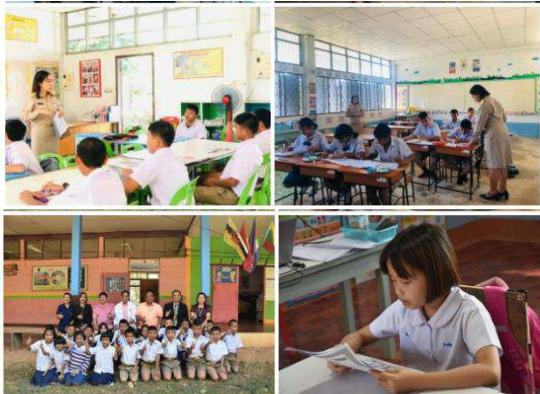
ออกนิเทศติดตาม