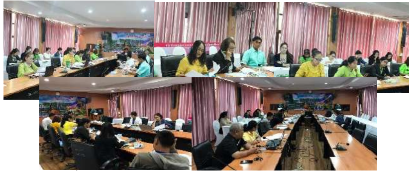
การจัดประชุมเพื่อบริหารงบประมาณของ สพป.เพชรบูรณ์ เขต 3 ทุกรายการ และพิจารณาเรียงลำดับตามความเหมาะสม