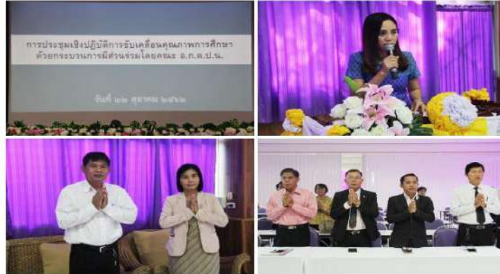
การสร้างองค์ความรู้โดยประชุมเชิงปฏิบัติการการขับเคลื่อนคุณภาพการศึกษา ด้วยกระบวนการมีส่วนร่วม ก.ต.ป.น. และ อ.ก.ต.ป.น. ในวันที่ 22 ตุลาคม 2562

1. โครงการส่งเสริมการขับเคลื่อนคุณภาพการศึกษาด้วยกระบวนการ มีส่วนร่วมโดย คณะกรรมการติดตาม ตรวจสอบ ประเมินผลและนิเทศการศึกษา (ก.ต.ป.น.)