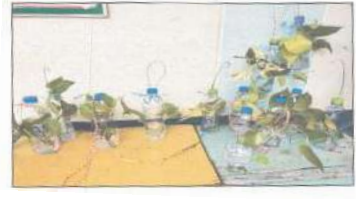
การจัดกิจกรรมของโรงเรียนที่ได้รับจัดสรรงบประมาณตามโครงการสร้างจิตสำนึก และความรู้ในการผลิตและบริโภคที่เป็นมิตรกับสิ่งแวดล้อม ปีงบประมาณ พ.ศ. 2563