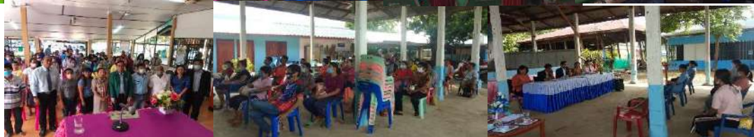
การประชุมชี้แจงสร้างความเข้าใจการควรวมโรงเรียนขนาดเล็กให้กับผู้ปกครองนักเรียน คณะกรรมการสถานศึกษาขั้นพื้นฐาน ผู้อำนวยการโรงเรียน ครูและบุคลากรทางการศึกษา โรงเรียนกลุ่มเป้าหมาย