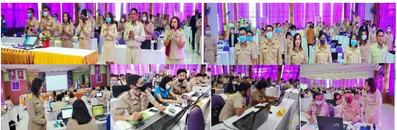
การจัดประชุมเชิงปฏิบัติการเพื่อให้ความรู้และพัฒนาเว็บไซต์สถานศึกษา (โรงเรียนคุณภาพประจำตำบล)