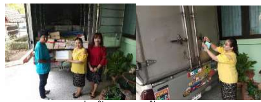
ส่งข้อสอบให้ สทศ.