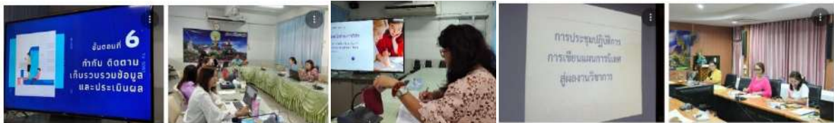
การประชุมเชิงปฏิบัติการเสริมสร้างทักษะการวิจัยการศึกษา