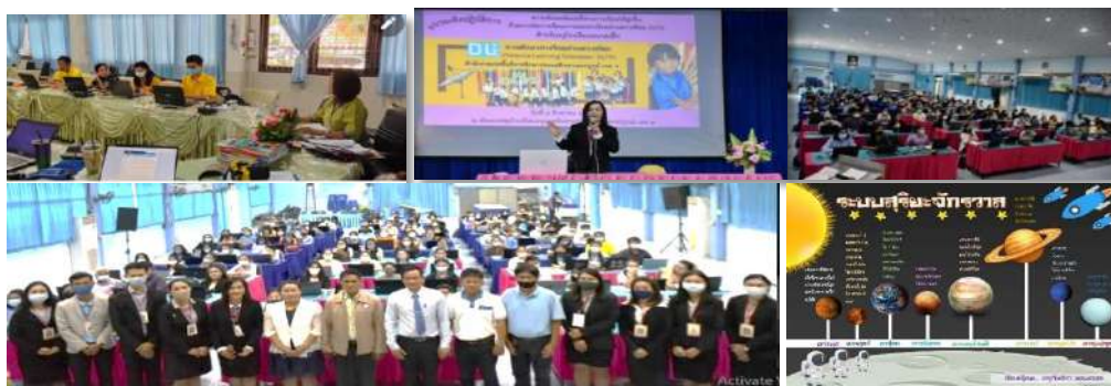
การประชุมคณะวิทยากร และการอบรมเชิงปฏิบัติการยกระดับผลสัมฤทธิ์ทางการเรียนให้สูงขึ้น ด้วยการจัดการเรียนการสอนทางไกลผ่านดาวเทียม DLTV ให้กับครูผู้สอนโรงเรียนขนาดเล็ก