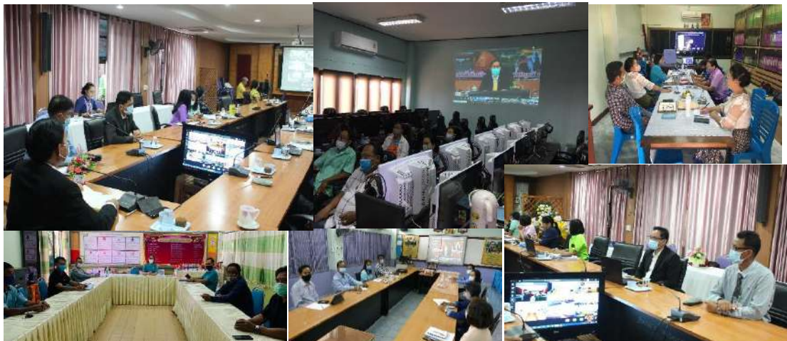
การจัดประชุมทางไกลในการขับเคลื่อนการจัดการเรียนการสอนทางไกล ในสถานการณ์การแพร่ระบาดของโรคติดเชื้อไวรัสโคโรนา 2019 (COVID-19)