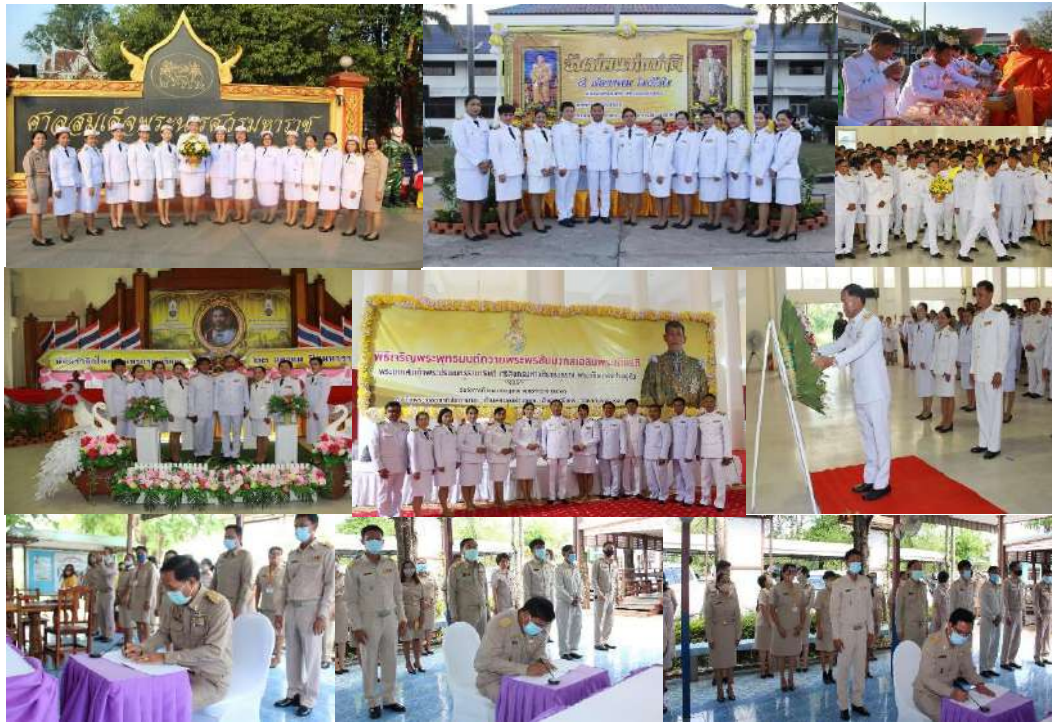
บุคลากรในสังกัดเข้าร่วมกิจกรรมวันสำคัญ