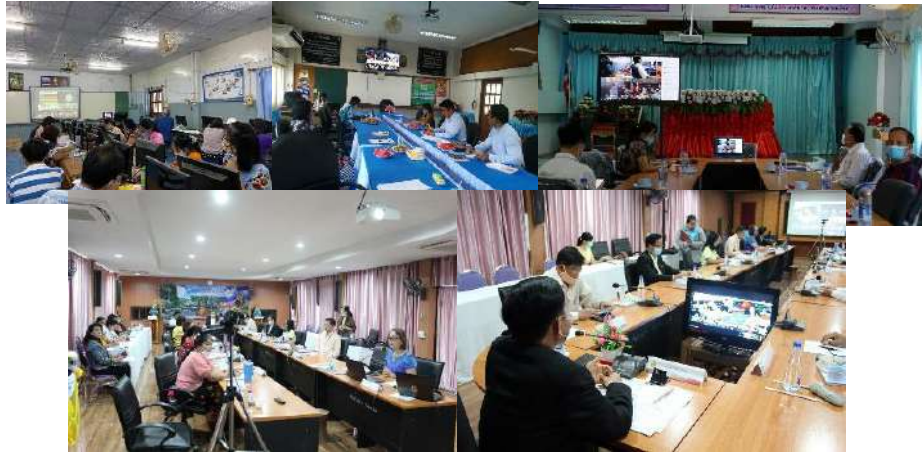
การประชุมสัมมนาผู้บริหารสถานศึกษาและผู้บริหารการศึกษา สำนักงานเขตพื้นที่การศึกษาประถมศึกษาเพชรบูรณ์ เขต 3 ผ่านทางจอภาพ (Conference)