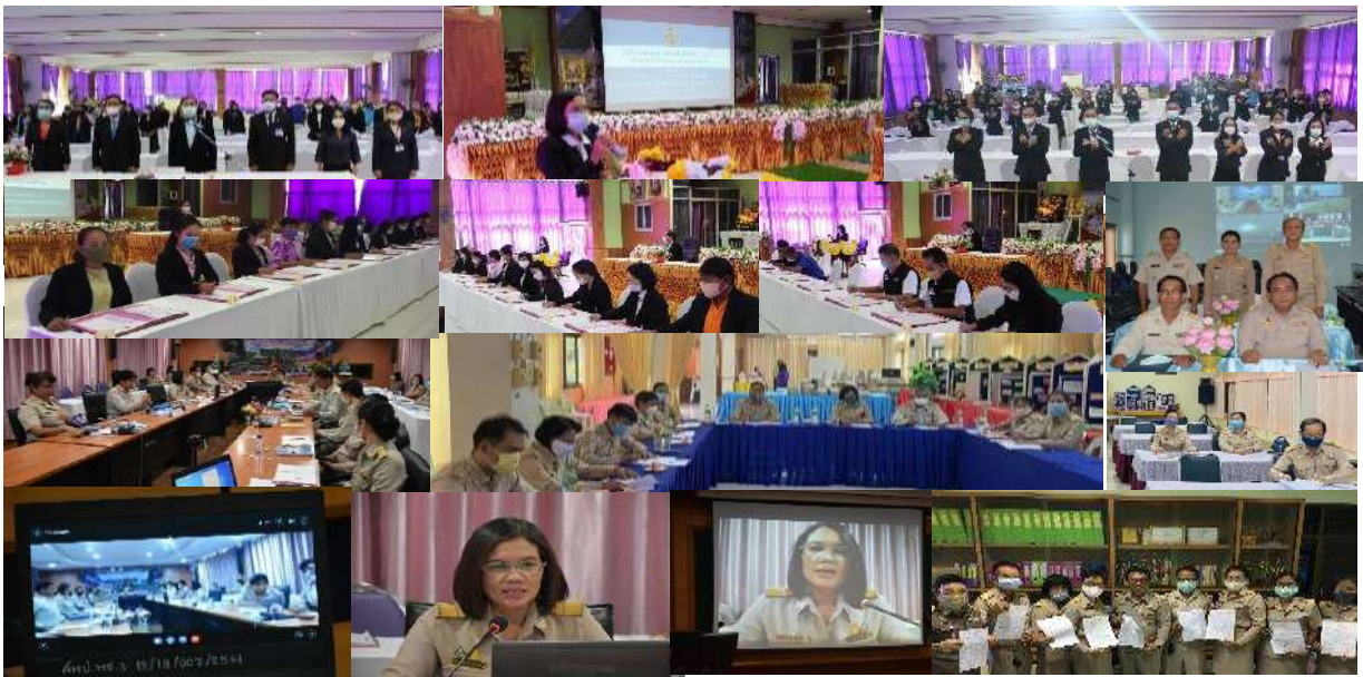
การบันทึกข้อตกลง (MOU) ในการเสริมสร้างคุณธรรม จริยธรรม และความโปร่งใส