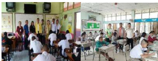
การนิเทศนามสอบ