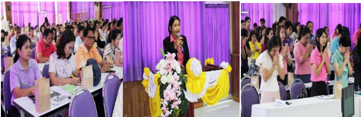
การจัดประชุมชี้แจง และทำความเข้าใจกระบวนการคัดกรอง รับรอง ตรวจสอบข้อมูล และการใช้จ่ายเงินในระบบคัดกรองปัจจัยนักเรียนยากจนพิเศษแบบมีเงื่อนไข