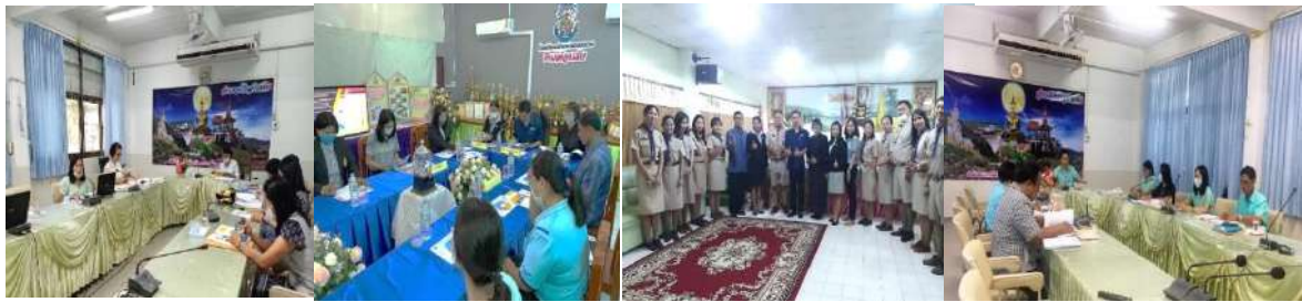
การจัดประชุมวางแผนคัดเลือกสถานศึกษาระบบดูแลช่วยเหลือนักเรียนและครูต้นแบบการจัดการเรียนรู้บูรณาการทักษะชีวิต ประจำปี 2563 ออกประเมินเชิงประจักษ์ และสรุปผลการพิจารณา