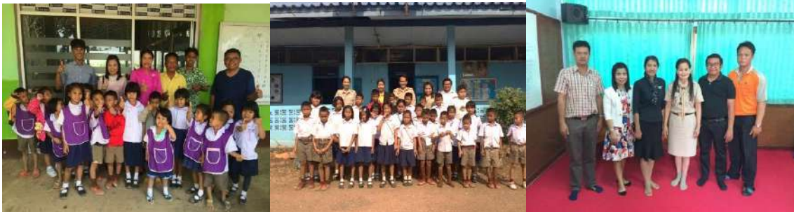
การนิเทศ ติดตามเชิงประจักษ์การดำเนินงานเกี่ยวกับการสนับสนุน และติดตามกระบวนการคัดกรอง รับรอง ตรวจสอบข้อมูล และการใช้จ่ายเงินในระบบคัดกรองปัจจัยนักเรียนยากจนพิเศษแบบมีเงื่อนไข