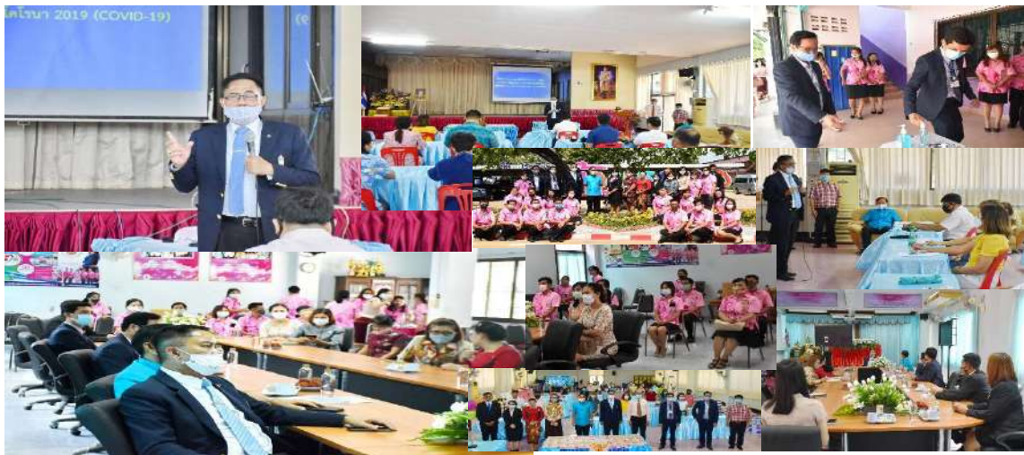
การตรวจเยี่ยมจากสำนักงานคณะกรรมการการศึกษาขั้นพื้นฐาน เพื่อสำรวจ รวบรวมข้อมูล การตรวจสอบความพร้อมในการจัดการเรียนการสอนทางไกล ในสถานการณ์การแพร่ระบาดของโรคติดเชื้อไวรัสโคโรนา 2019 (COVID-19) ก่อนเปิดเรียน ณ โรงเรียนบ้านราहुล และโรงเรียนบ้าน กม.35