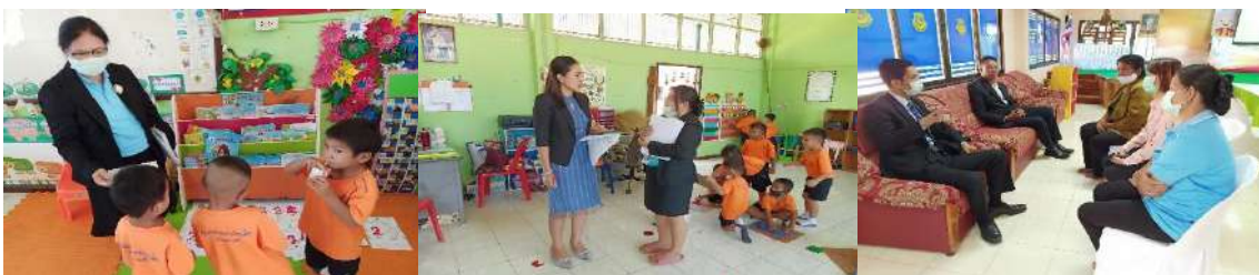
การประเมินผลสถานศึกษาเพื่อรับรางวัลพระราชทาน