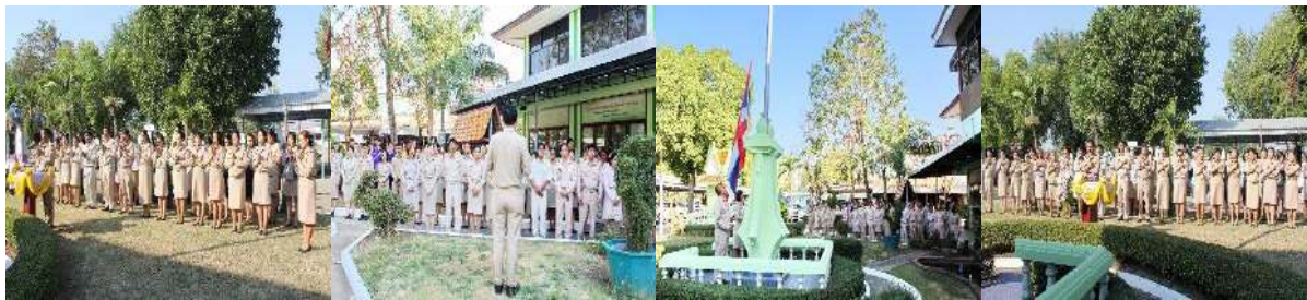
การสร้างการรับรู้การดำเนินงานในด้านการส่งเสริมจริยธรรมและต่อต้านการทุจริต