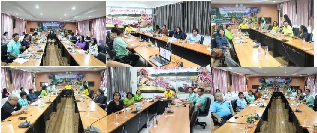
การประชุมเสวนาสภากาแฟเชาทุกวันพุธ