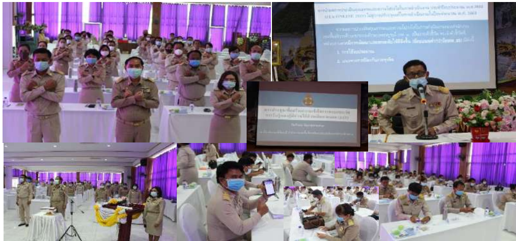
การจัดประชุมเพื่อเสริมสร้างความรู้ความเข้าใจในการตอบแบบวัดการรับรู้ ของผู้มีส่วนได้ส่วนเสียภายนอก (EIT)