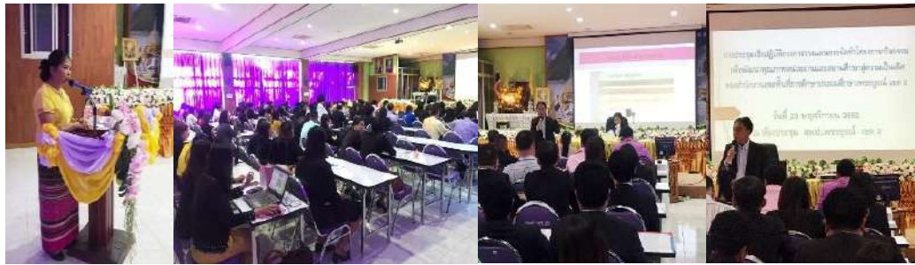
การประชุมเชิงปฏิบัติการการวางแผนและการจัดทำโครงการ/กิจกรรม เพื่อพัฒนาคุณภาพหน่วยงานและสถานศึกษาสู่ความเป็นเลิศ ของ สพป.เพชรบูรณ์ เขต 3