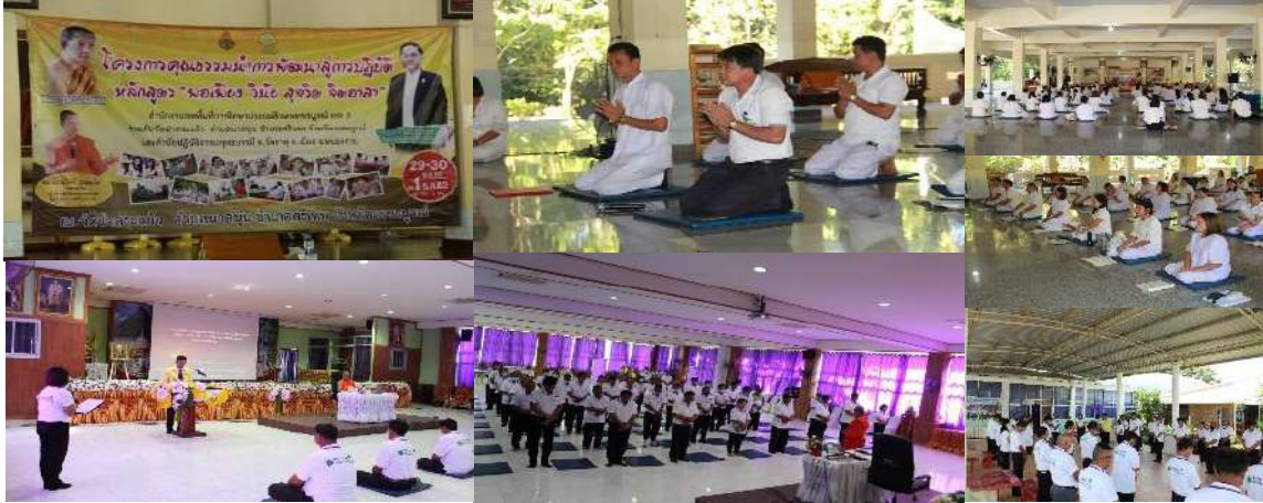
การอบรมเชิงปฏิบัติการป้องกันการทุจริตด้วยคุณธรรมจริยธรรม