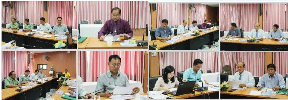
การประชุมคณะกรรมการบริหารอัตรากำลังข้าราชการครูและบุคลากรทางการศึกษา