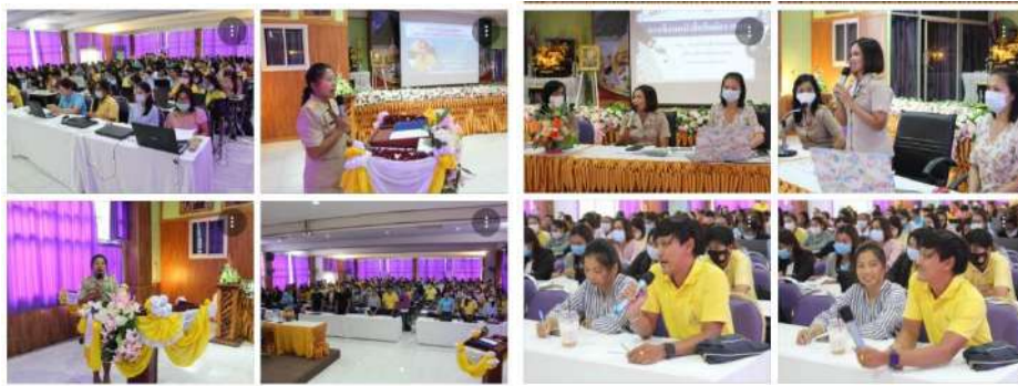
การพัฒนาบุคลากรทางการศึกษาสายสนับสนุนการสอน (ผู้ปฏิบัติงานธุรการโรงเรียน)