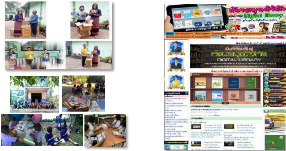
การส่งมอบสื่อและนิเทศติดตามการใช้สื่อ