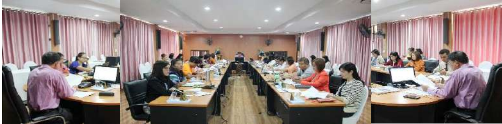
การจัดประชุมคณะทำงานสรุปผลการดำเนินงานตามแผนปฏิบัติการ ประจำปีงบประมาณ พ.ศ.2562 ของ สพป.เพชรบูรณ์ เขต 3