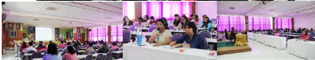
การประชุมข้าราชการ/ลูกจ้าง ภายในสำนักงานเขตพื้นที่การศึกษา