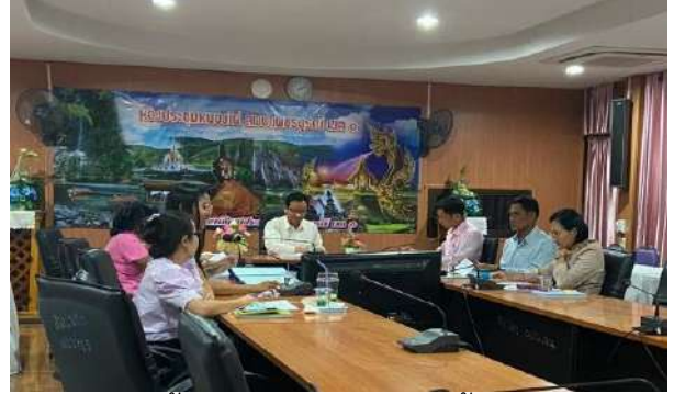
การประชุมคัดเลือกโรงเรียนในการจัดสรรงบประมาณโครงการสร้างจิตสำนึกและความรู้ในการผลิต และบริโภคที่เป็นมิตรกับสิ่งแวดล้อม ปีงบประมาณ พ.ศ. 2563