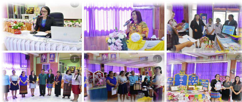
การประกวดโรงเรียนที่มีวิธีปฏิบัติที่เป็นเลิศ (Best Practices) การจัดการศึกษาทางไกลผ่านดาวเทียม (DLTV)