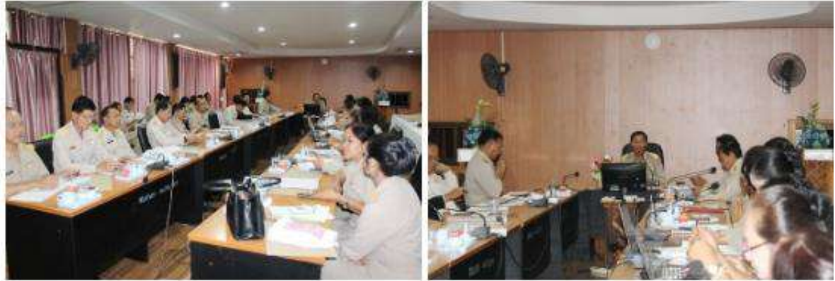
การประชุม การนิเทศติดตามและประเมินผลตามนโยบายมาตรการ และแนวทางขับเคลื่อนคุณภาพการศึกษา โดยคณะอนุกรรมการ อ.ก.ต.ป.น