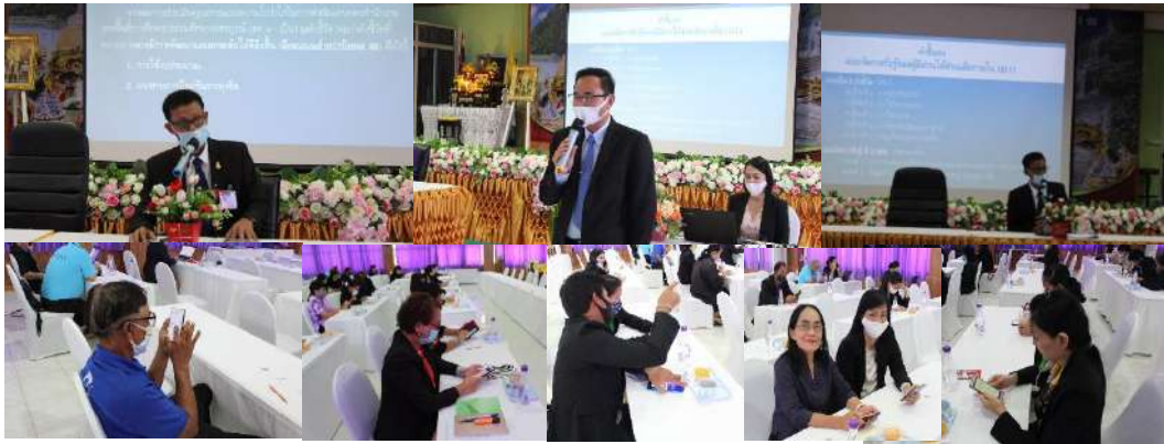
การประชุมเพื่อเสริมสร้างความรู้ความเข้าใจในการตอบแบบวัดการรับรู้ ของผู้มีส่วนได้ส่วนเสียภายใน (IIT) แก่บุคลากรในสำนักงานฯและตอบแบบวัดการรับรู้โดยอิสระ