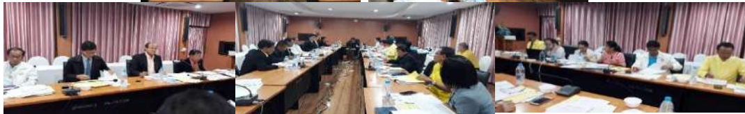
การประชุมพิจารณาการจัดตั้งงบประมาณ ประจำปีงบประมาณ พ.ศ.2564 รายการค่าครุภัณฑ์ ที่ดินและสิ่งก่อสร้าง และงบกระตุ้นเศรษฐกิจ