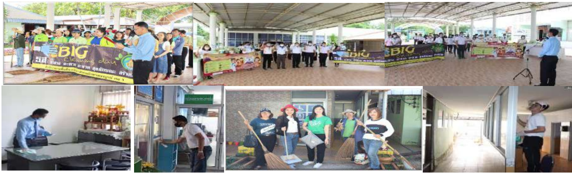
กิจกรรม 5 ส. (Big Cleaning Day)