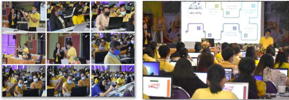
การอบรมเชิงปฏิบัติการ Coding/AI/Digital เพื่อการเรียนการสอน