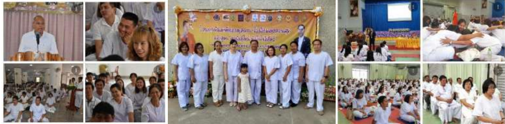
การพัฒนาศักยภาพบุคลากร (โรงเรียนแห่งความสุข) หลักสูตร “ครูพันธุ์ใหม่ หัวใจโพธิ์สัตว์”