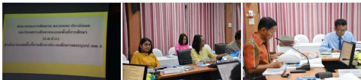
การจัดประชุม ก.ต.ป.น. เพื่อรายงานผลการบริหารจัดการศึกษาของเขตพื้นที่การศึกษา และพิจารณาให้ความเห็นชอบเพื่อพัฒนาคุณภาพการจัดการศึกษาให้มีคุณภาพสูงขึ้น