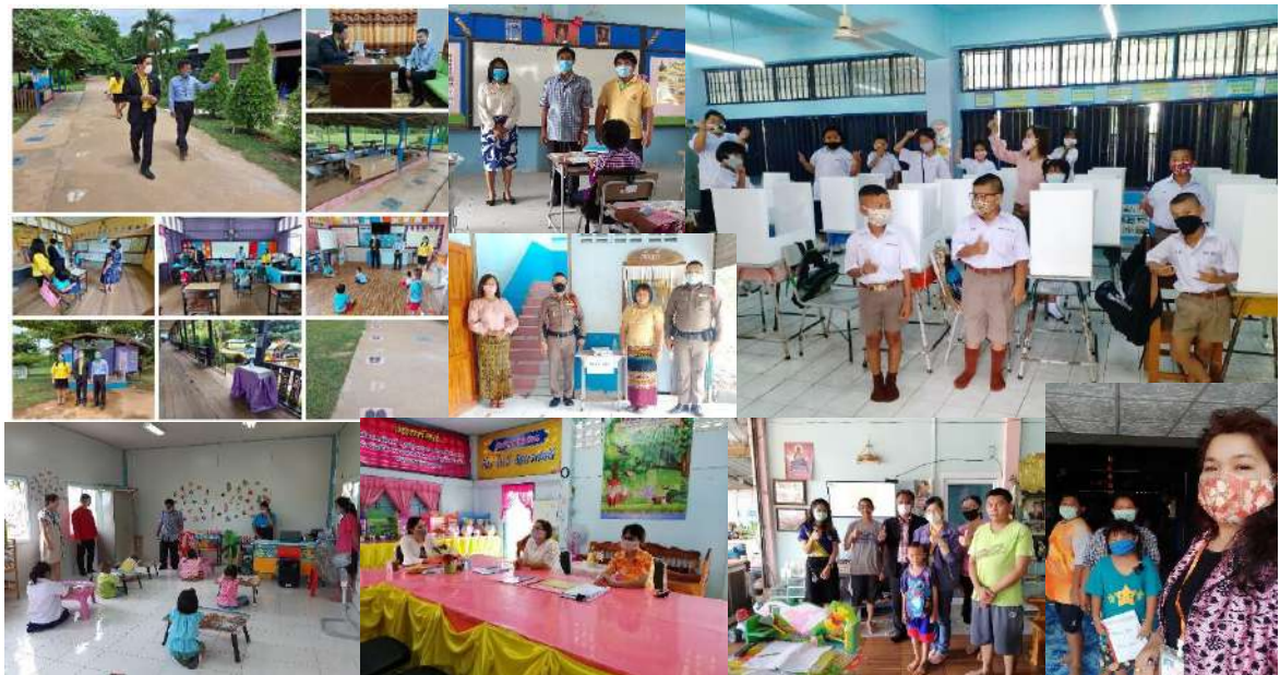
การนิเทศติดตามความพร้อมเปิดภาคเรียนที่ 1 ปีการศึกษา 2563 เพื่อเฝ้าระวังและป้องกันการแพร่ระบาดของโรคติดเชื้อไวรัสโคโรนา 2019 (COVID-19)