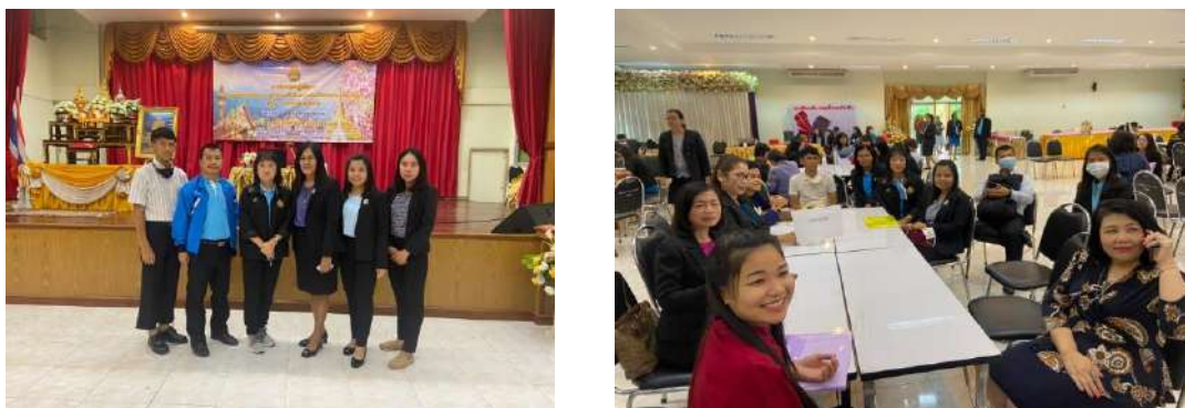
การเข้าร่วมศูนย์เฉพาะกิจคุ้มครองและช่วยเหลือนักเรียน