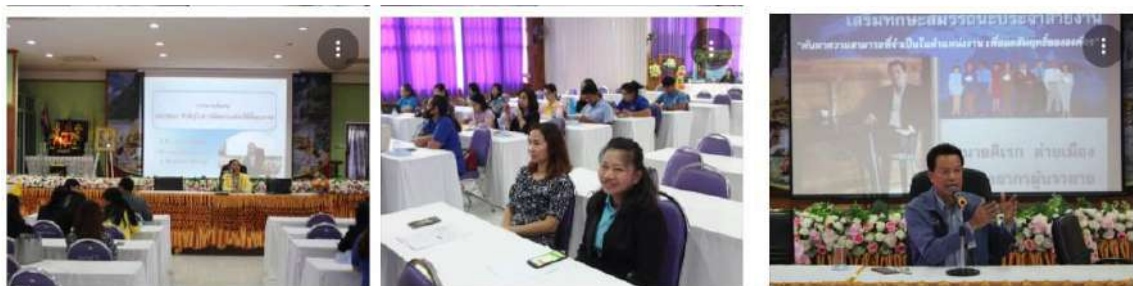
การประชุมเชิงปฏิบัติการ “เสริมทักษะสมรรถนะประจำสายงาน”