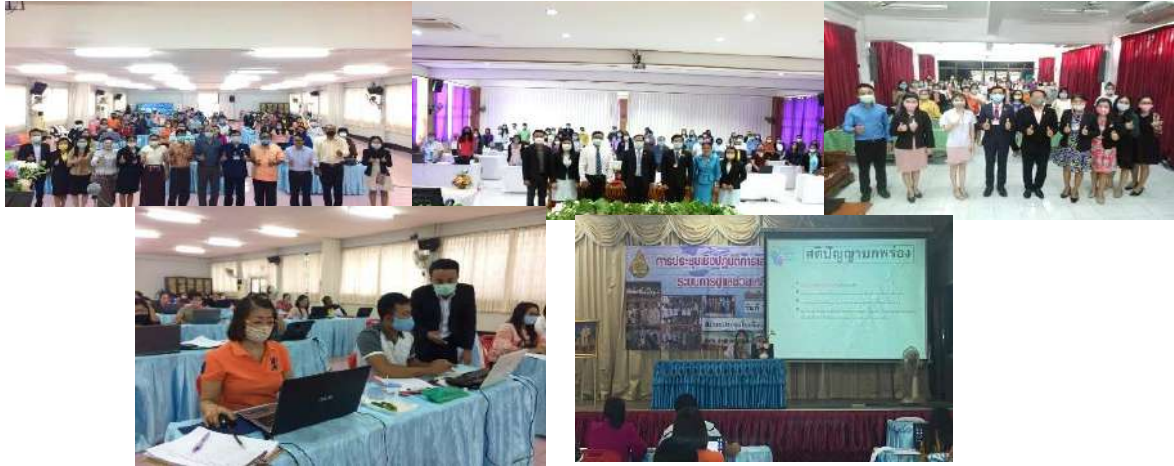
การจัดประชุมเชิงปฏิบัติการเสริมสร้างพัฒนาระบบการดูแลช่วยเหลือนักเรียน