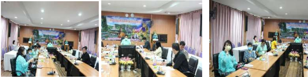
การจัดประชุมระดับเขตพื้นที่การศึกษาในการขับเคลื่อนการจัดการเรียนการสอนทางไกล ในสถานการณ์การแพร่ระบาดของโรคติดเชื้อไวรัสโคโรนา 2019 (COVID-19)