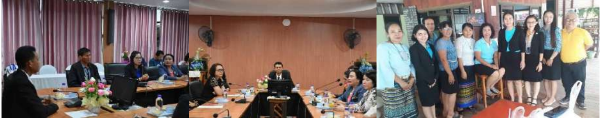
การต้อนรับคณะศึกษาดูงาน