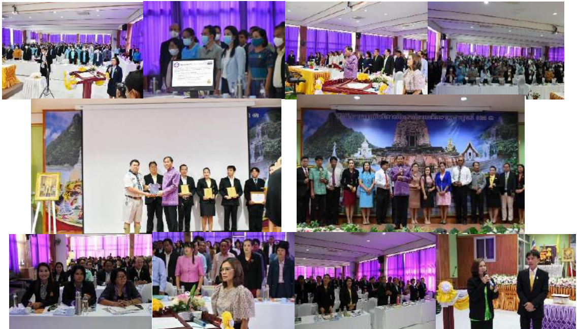
การประชุมสัมมนาผู้บริหารสถานศึกษาและผู้บริหารการศึกษา สำนักงานเขตพื้นที่การศึกษาประถมศึกษาเพชรบูรณ์ เขต 3