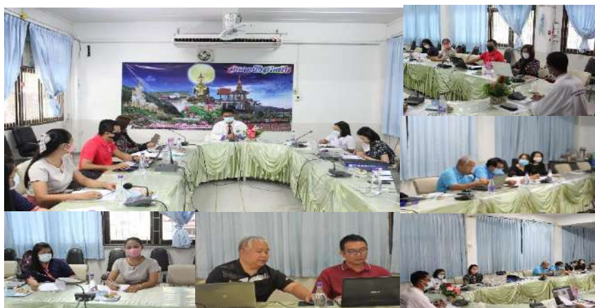
การประชุมคณะกรรมการเพื่อพัฒนาเว็บไซต์สำนักงานเขตพื้นที่การศึกษาประถมศึกษาเพชรบูรณ์ เขต 3 ให้มีความทันสมัย สวยงาม เข้าถึงข้อมูลได้ง่าย และสะดวก