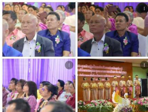
การประชุมเชิงปฏิบัติการการครองตนในการปฏิบัติงานที่ดีและยกย่องเชิดชูเกียรติ