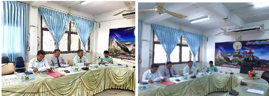
ประชุมการคัดเลือกรางวัลข้าราชการพลเรือนดีเด่น ประจำปี พ.ศ.2562